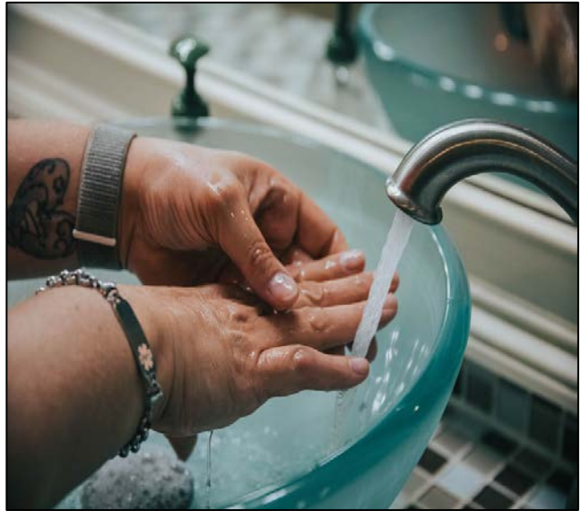
[E qotsitse ho tswa inthaneteng ya lokiswa ke mohlalobi]

O moqolotsi wa ditaba tsa koranta ya Manti mme o tlameha ho ya etsa inthaviu le letona la tsa bophelo bo botle ka koduwa ya kokwanahloko ya "coronavirus" e hlasetseng lefatshe ka bophara. Ngola inthaviu mahareng a hao le letona la tsa bophelo bo botle.