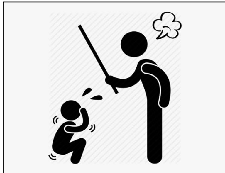
[E qotsitswe inthaneteng ya lokiswa ke mohlahlubi]

Sebedisa setshwantsho se ka hodimo ho ngola kholomo ya makasine ka tlhekefetso ya bana malapeng. Bolelele ba mantswe e be a 200–250 . Hopola ho ba le sehlooho se hohelang.