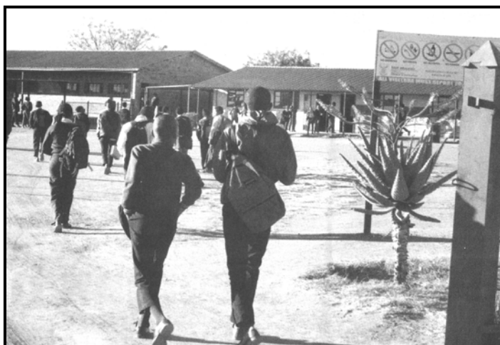
[Se nopotswe go tswa mo, The New Age , 20 Tlhakole 2018]

Tshireletsego mo dikolong ke tlhobaboroko. Kwalela Tonakgolo ya Lefapha la Tshireletso lekwalo o mo kope go dira lenaneo la dikgakololo tsa tshireletso ya barutwana le barutabana mo dikolong.