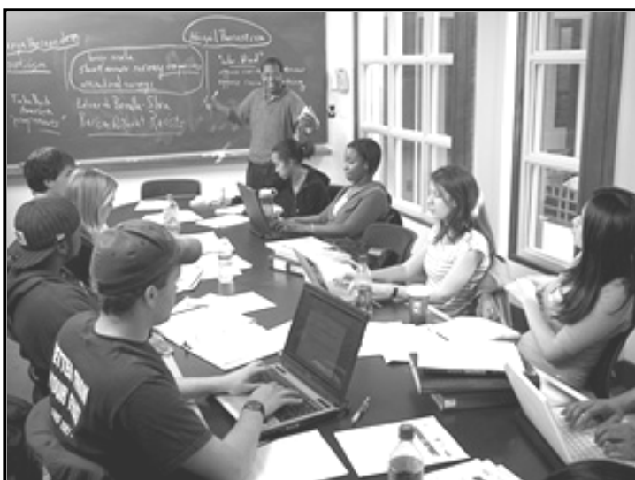
[Se nopotswe go tswa mo inthaneteng]

O tsenetse dithuto tsa malatsi a boikhutso kgatlhanong le maikutlo a ga mogoloo yo o neng a bona e le tshenyo ya nako. Batsadi ba gago ba ne ba dumelana le wena, mme ba go ema nokeng. Ba kwalele lekwalo o ba leboge le go ba bolelela ka fa di go thusitseng ka gona go ipaakanyetsa ditlhatlhobo tsa makgaolakgang.