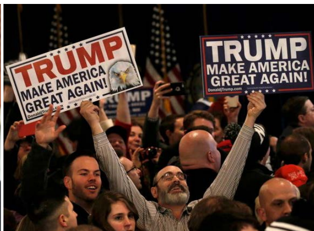
TRUMP Maak Amerika weer groot!

[Aangepas uit: < http://english.alarabiya.net/en/views/news/middle-east/2016/11/10/Trump-and-Brexit-shock-the-system.html >]