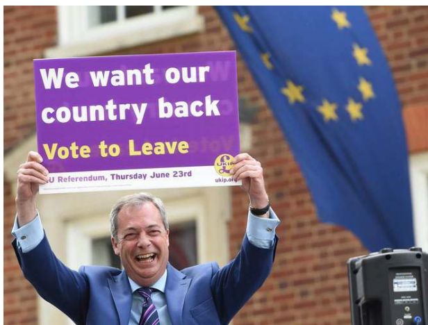
Ons wil ons land terughê Stem om te gaan

Tog moet progressiewes 'n paar pynlike lesse leer. Te veel mense is agtergelaat, sien globalisering as 'n bedreiging en is bang om hul kernidentiteit te verloor. In beide die VSA en Brittanje en in baie van die res van Europa koester groot dele van die bevolking verandering. Hierdie kiesers sal nie net outomaties terugkeer na die arms van gematigde partye wanneer die verregses misluk nie. Vars visie en leierskap is nodig wat ware en blywende verandering kan lewer.